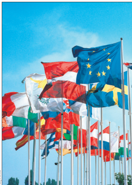
▲ Avec ses 27 membres, l'UE est désormais « un empire qui met un terme aux empires ».

La frustration des commentateurs devant les lenteurs et les attermoissements de la construction européenne est compréhensible. Mais elle procède d'une vision à court terme faisant bon marché des progrès gigantesques accomplis depuis la Seconde Guerre mondiale. L'Europe en était sortie exsangue, divisée, à la merci du bon vouloir des supergrands américain et soviétique. Soixante-cinq ans plus tard, elle a réussi sa réunification en intégrant les pays du défunt bloc communiste sur la base de valeurs communes : démocratie, Etat de droit, respect des minorités. Grâce à l'Accord de Schengen, l'Européen continental se meut